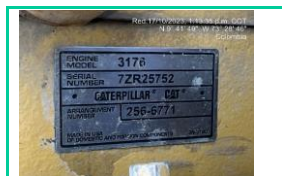
Serie Motor LH